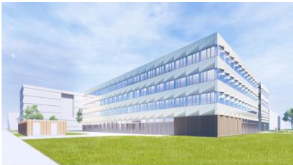
Project Next Delft

Hieronder zie je twee verschillende gevels. Jullie schoolgebouw heeft uiteraard ook een gevel. Neem die mee in de vergelijking