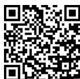
Uitdagingen van TGM bij de Mall of the Netherlands ii