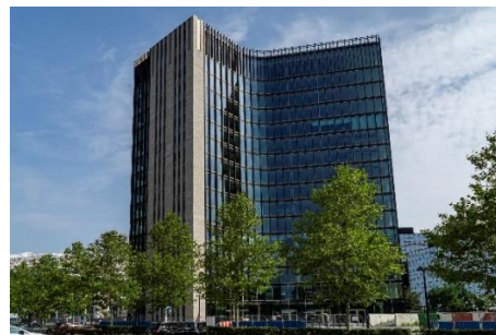
Project De Oliphant

TGM maakt vaak al vroeg in het proces deel uit van het bouwadviesteam: (hoe) kan het idee van de architect uitgevoerd worden in de praktijk? In de volgende stap vertalen zij het ontwerp naar technisch maakbare oplossingen die voldoen aan de prestatie-eisen en aan wat nodig is op het gebied van kwaliteit, budget en planning. Daarna gaan de engineers aan de slag: zij ontwerpen de gevel-onderdelen in detail, bedenken h oe je die kunt maken en maken werkplaatstekeningen. Daarna zorgen ze dat de onderdelen gemaakt worden, op de plaats van bestemming komen en op het gebouw gemonteerd worden.