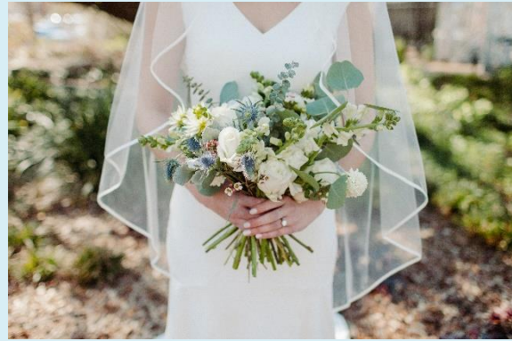
Voile wordt ook veel toegepast in bruidsjurken

De opdracht voor de Mall of the Netherlands was om een gevel te ontwerpen voor een 'instagrammable' gebouw. De architect had de wens om een voile te ontwerpen die "soepel" is en als een tweede huid om het gebouw is gedrapeerd.