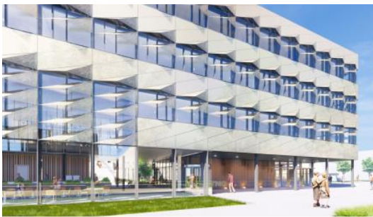
Project Next Delft

TGM werkt vooral aan complexe, omvangrijke en innovatieve projecten die aan de allerhoogste prestatie-eisen moeten voldoen.